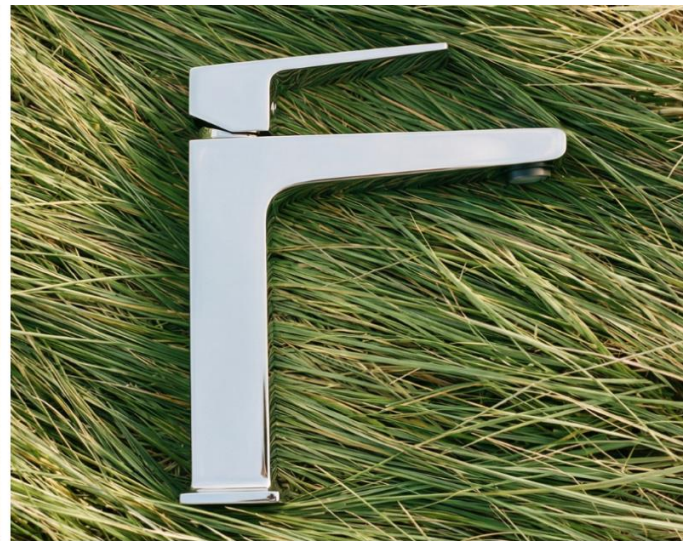
Monomando corto para lavabo NAYA 9479NA