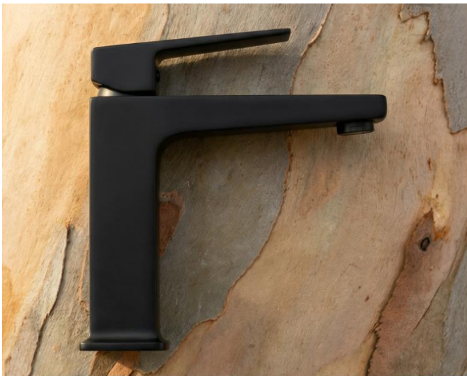
Monomando corto para lavabo NAYA 9479NA.2

"NAYA" se relaciona con el concepto de camino o vía, en muchas culturas indígenas, los ríos, arroyos o corrientes de agua son vistos como caminos que conectan diferentes territorios o incluso mundos espirituales. En este sentido, el agua fluye a lo largo de su "camino" natural, y podría verse como un "naya", un sendero vital que lleva vida y conecta comunidades y/o ecosistemas.